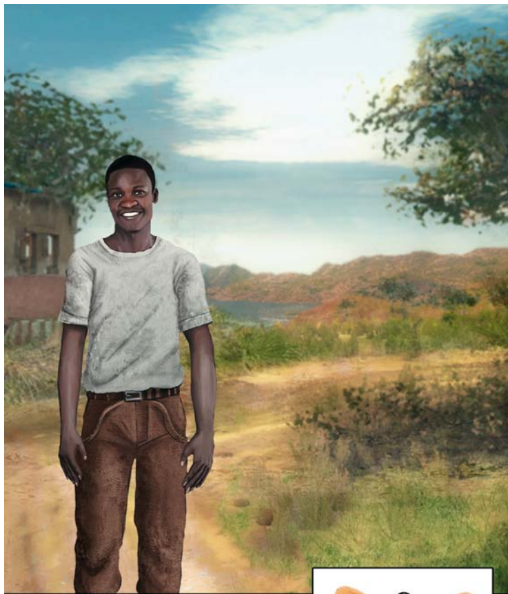
Ntumba Verkäufer, 22 Jahre