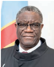
Dr. Denis Mukwege, Panzi-Hospital Bukavu: Traumatisierte Opfer und straffreie Täter – der Skandal im Ostkongo